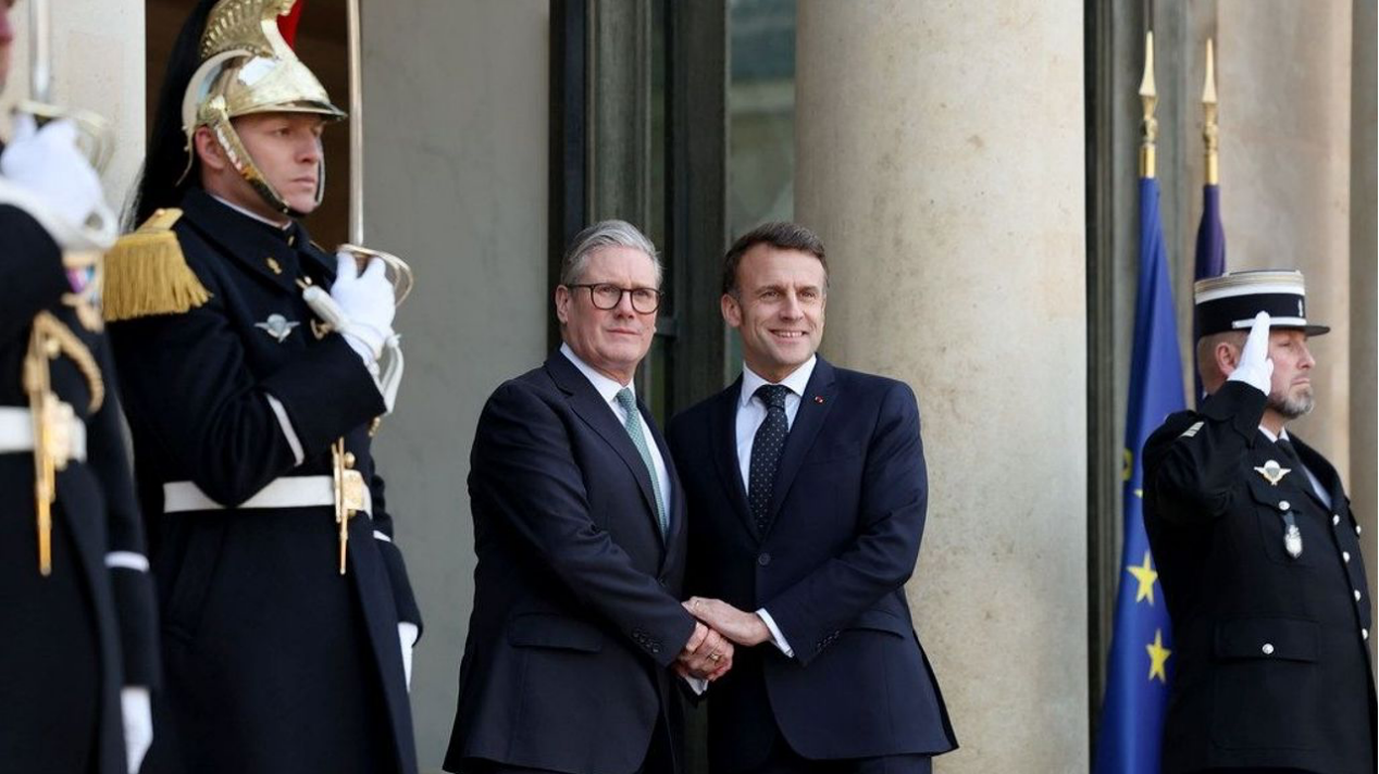
යුක්රේනය පිළිබඳ සාකච්ඡා සඳහා 2025 පෙබරවාරි 17 වන දින එලිසී මාලිගයේදී ප්‍රංශ ජනාධිපති එමානුවෙල් මැක්‍රොන් විසින් පවත්වන ලද රැස්වීමකට එක්සත් රාජධානියේ අගමැති ශ්‍රීමත් කීර් ස්ටාර්මර් (වමේ, මැද) සහභාගී වේ.