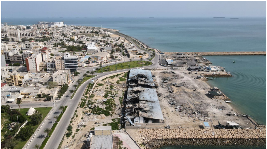
එක්සත් ජනපද-ඊශායල් හමුදා මෙහෙයුම අතරතුර පසුගියදා ඉවත් ප්‍රහාර කිහිපයකින් ඉරානයේ කෙෂ්මි දූපතේ වරායේ ධීවර නොටුපලට සිදු වූ හානිය. හෝමුස් සමුද්‍ර සන්ධියේ නැව් පසුබිමේ. 2026 අප්‍රේල් 13 වන සඳුදා. [AP ඡායාරූපය/අස්ගාර් බෙෂාරති]

ඇමරිකානු උප ජනාධිපති ජේ.ඩී. වැන්ස් අඟහරුවාදා පැනැදිලි කළේ, මෙම ඇමරිකානු ආක්‍රමණශීලී යුද්ධය මැද පෙරදිග ප්‍රතිව්‍යුහගත කිරීම අරමුණු කරගත් එකක් බවයි. ජනාධිපති ඩොනල්ඩ් ට්‍රම්ප් “කුඩා ගනුදෙනු” ගැන උනන්දුවක් නොදක්වන නමුත් ඉරානය