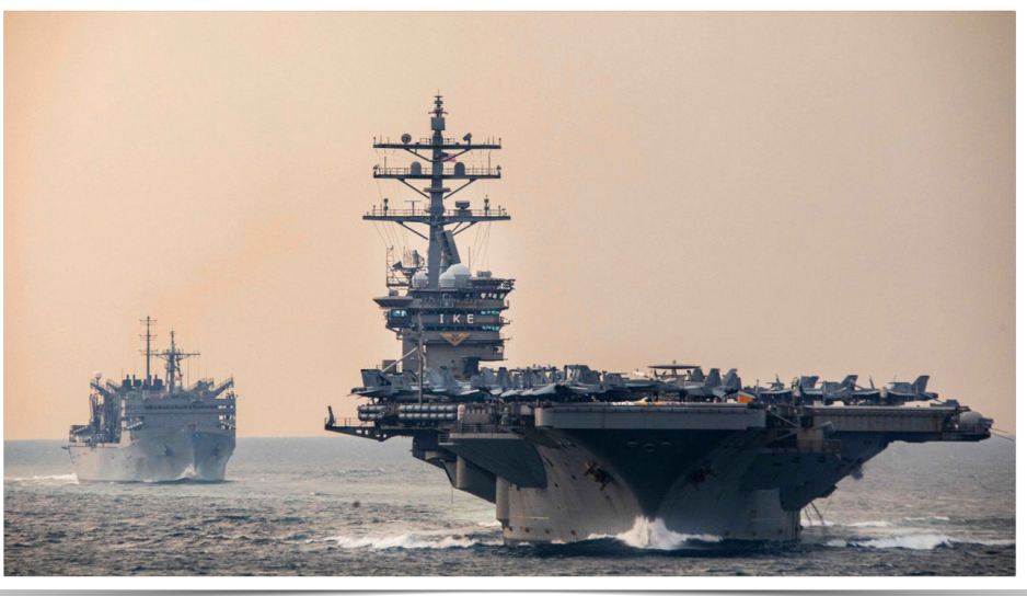
2023 දෙසැම්බර් 14 වන දින, ගුවන් යානා ප්‍රවාහන නෞකාවක් වන යූඑස්එස් ඩවයිඩ් ඩී. අයිසන්හවර් (USS Dwight D. Eisenhower) සහ වෙගවන් සටන් ආධාරක නෞකාවක් වන යූඑස්එන්එස් සප්ලයි (USNS Supply) නෝමූස් සමුද්‍ර සන්ධිය තරනා ගමන් කරයි.

අවම වශයෙන් පුද්ගලයින් 254 දෙනෙකු මිය ගිය අතර ළමුන් 35 දෙනෙකු ඇතුළුව 1,100 කට වැඩි පිරිසක් තුවාල ලැබූහ. මධ්‍යම බේරූට් සහ දකුණු තදාසන්න ප්‍රදේශ තරනා මහල් නිවාස ගොඩනැගිලි, නේවාසික විදි සහ ජනාකීර්ණ වාණිජ ප්‍රදේශවලට ඊශ්‍රායල ජෙට් යානා මගින් ප්‍රහාර එල්ල විය.