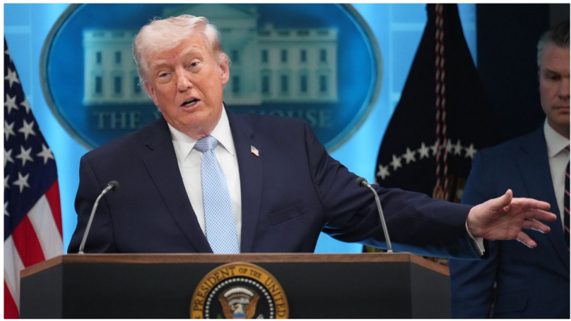
ජනාධිපති ඩොනල්ඩ් ට්‍රම්ප් 2026 අප්‍රේල් 6 වන සඳුදා වොෂින්ටනයේ ධවල මන්දිරයේ සේමස් බ්‍රැඩ් මාධ්‍ය නමුවේදී මාධ්‍යවේදීන් සමඟ කතා කරයි.

එකක උරුමකරු වේ. යුද්ධයේ පළමු දිනයේ දී Shajareh Tayyebeh බාලිකා පාසලට එල්ල වූ ඇමරිකානු මිසයිල ප්‍රහාරයකින් මියගිය ළමුන් 168 දෙනෙකු ඇතුළුව එහි සිවිල් වැසියන් දහස් ගණනක් දැනටමත් ඝාතනය කර ඇත. රෝහල්, විශ්ව විද්‍යාල, නේවාසික ප්‍රදේශ සහ පාසල් වලට ක්‍රමානුකූලව බෝම්බ හෙලා ඇත. ලෝක සමාජවාදී වෙබ් අඩවිය අනතුරු අඟවා ඇති පරිදි, ප්‍රහාරක උත්සන්න කිරීමේ තර්කනය නොවැළැක්විය හැකිය: තීව්‍ර කරන ලද බෝම්බ හෙලීමේ සිට භූමි ආක්‍රමණය දක්වා, ඉරාන නගර අත්පත් කර ගැනීම දක්වා සහ අවසානයේ – වැඩිවන ඇමරිකානු නාහි සහ හමුදා අසාර්ථකත්වය හමුවේ – න්‍යෂ්ටික අවි වෙත යොමු වීම දක්වා එය උත්සන්න වනු ඇත.