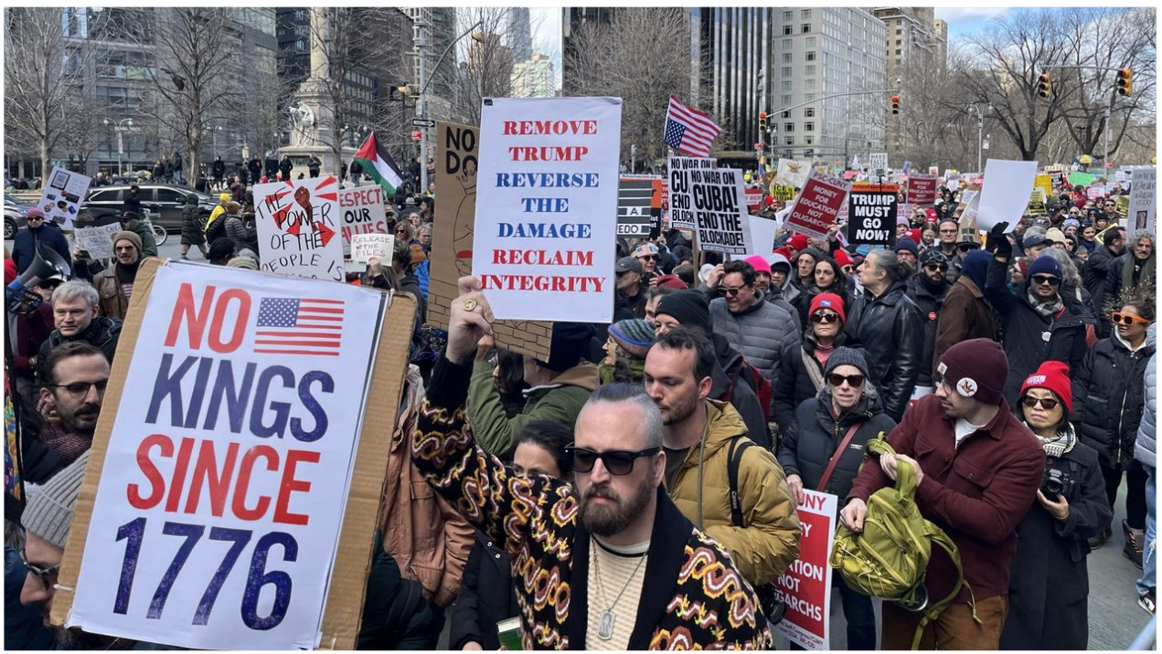
2026 මාර්තු 28 වන දින නිව්යෝර්ක් නගරයේ පැවති දැවැන්ත “නෝ කිංග්ස්” රැලියේ කොටසක්.

දැන් මාසයක් පැරණි ඉරානයට එරෙහි යුද්ධය, රැළි වලට සහනාගී වූවන්ට තීරණාත්මක උදව්ගතකර බලවේගයක් විය. විරෝධතා කැඳවූ සංවිධාන විසින් එය අවකස්සේරු කරන ලද නමුත්, නගරයෙන් නගරයට සංකේත සහ ගායනා මගින් විරෝධය ප්‍රකාශ විය. පෙළපාලි පැවැත්වෙන අතරතුර, ට්‍රම්ප් විසින් ලෝකයට විනාශකාරී ප්‍රතිවිපාක