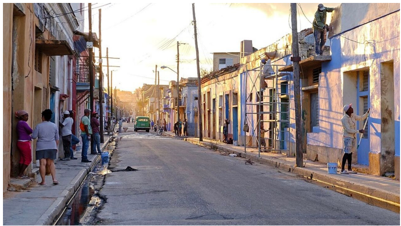
මහන්සාස්, කියුබාව

පෙන්ටගනයේ දක්ෂිණ අධිකාරිය කලාපය පුරා තම කඳවුරු පිහිටුවා ගැනීමේ අයිතිවාසිකම් ආක්‍රමණශීලී ලෙස අත්කර ගනිමින් ද, කැරබියන් සහ පැසිෆික් කලාපයේ නාවික මෙහෙයුම් පුළුල් කරමින් ද සිටී. මන්දව්‍ය පාවාරම පිළිබඳ සාක්ෂි නොමැතිව වෝදනා කරනු ලැබූ ධීවරයින් 157 දෙනෙකුගේ ජීවිත බිලිගත් දැනුදු කෙරීගෙන යන අඛණ්ඩ බෝම්බ හෙලීමේ ව්‍යාපාරයක් ද ඊට ඇතුළත් ය.