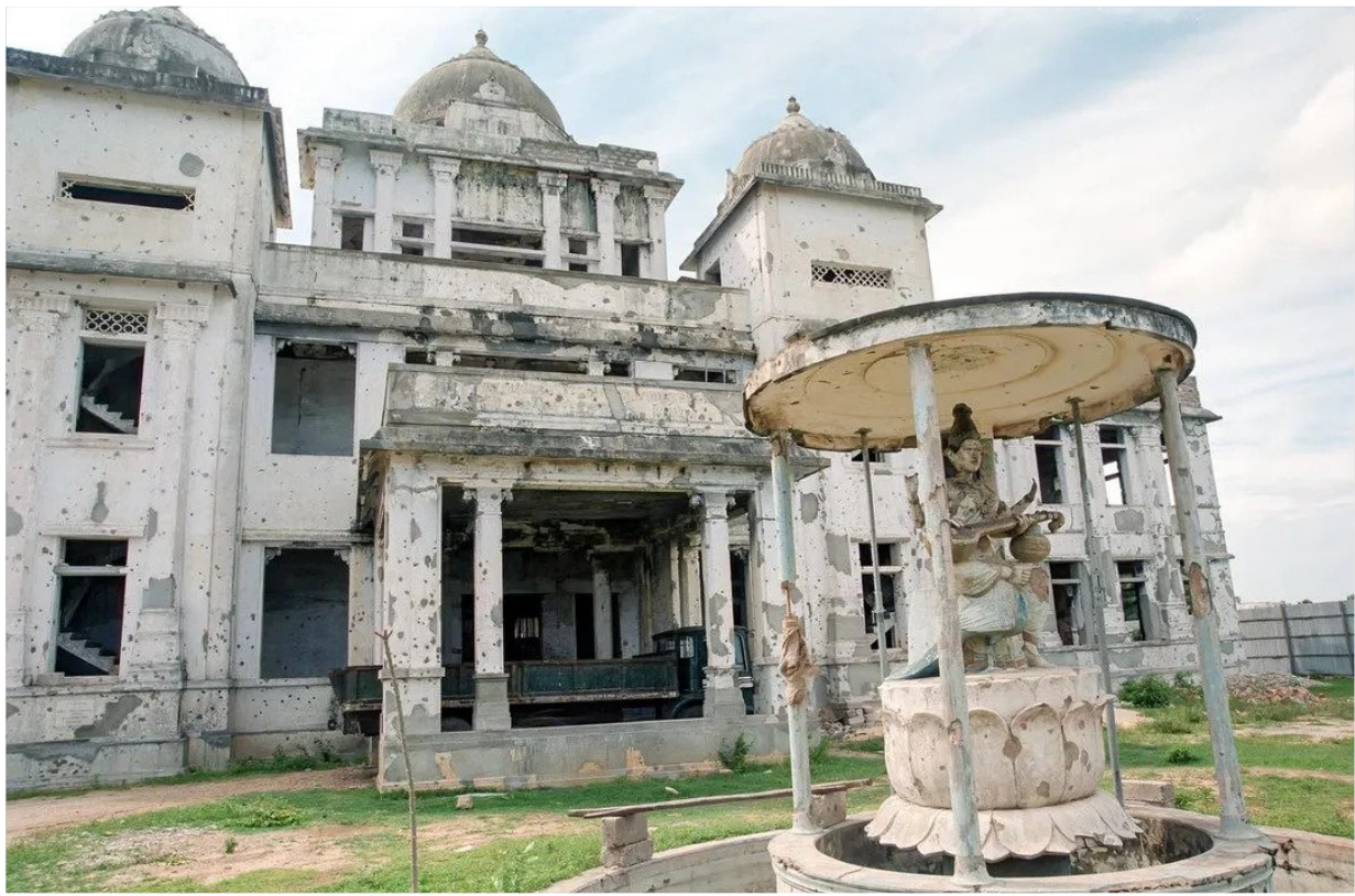
ගිනි තැබීමෙන් පසු යාපනය මහජන පුස්තකාලය.

මේ කතාව 2026 මැයි 31 දින thesocialist.lk හි “Never Again” – 45th Commemoration of the Jaffna Public Library Arson යන නිසිඟ් ඉංග්‍රීසි බසින් පල කෙරුණි.