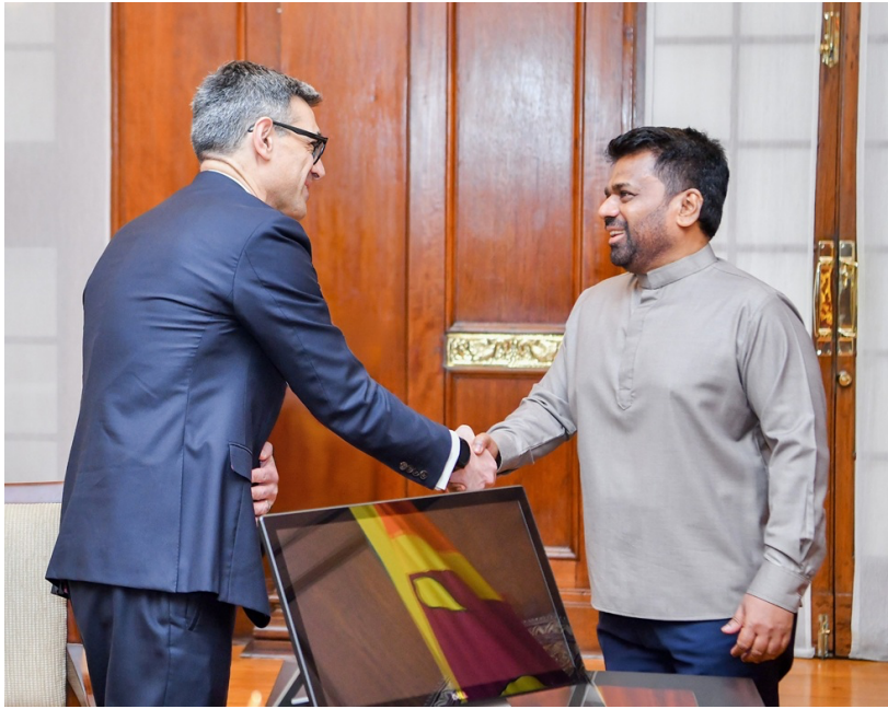
ජනාධිපති අනුර කුමාර දිසානායක 2026 අප්‍රේල් 2 වන දින ජනාධිපති ලේකම් කාර්යාලයේදී, මෙරට සංචාරයක නිරත ජාත්‍යන්තර මූල්‍ය අරමුදලේ (IMF) දූත පිරිසක් හමුවූ අවස්ථාව.

නතරවැන්න නම්, මෙම පනත් කෙටුම්පත මගින් සම්පූර්ණයෙන්ම රාජ්‍යය විසින් පත් කරනු ලබන ‘අතුරු සභාවක්’ (Interim Council) පිහිටුවීමයි. පාලක සභාව තේරී පත්වන තෙක්, අමාත්‍යවරයා විසින් “අමාත්‍යවරයාගේ අමාත්‍යාංශයේ ලේකම්වරයා” සහ “මාධ්‍ය ක්ෂේත්‍රයේ ප්‍රත්‍යක්ෂ වූ දැනුම, විශිෂ්ටත්වය සහ අවම වශයෙන් වසර විස්සක පළපුරුද්ද සහිත ප්‍රකට තැනැත්තන් හය දෙනෙකු” ගෙන් සමන්විත අතුරු සභාවක් පත් කළ යුතු බව 5(4)(අ) වගන්තිය මඟින් විධිවිධාන සලසයි.”තෝරාගත යුතු සාමාජිකයන් ගණන සහ ආයතන වෙත ඵකී සාමාජිකයන් තෝරා ගනු ලබන නිර්ණායක පිළිබඳව” මෙන්ම “සභාවට සාමාජිකයන් තෝරා පත් කර ගැනීම සහ පත් කර ගැනීම” සඳහා නීති සම්පාදනය කිරීමේ බලය 5(4)(ආ) වගන්තිය යටතේ මෙම අතුරු සභාවට පවරා ඇත. ඒ අනුව, ප්‍රථම අවස්ථාවේදීම මෙම ආයතනයට ඇතුළත් වන්නේ කවුරුන්ද යන්න සහ ඵකී ස්ථිර පාලක සභාවේ අසුන් ගන්නේ කවුරුන්ද යන්න පාලනය කරනු ලබන්නේ මෙම අතුරු සභාව විසිනි. සාමාජිකත්ව නිර්ණායක, අත්‍යන්තර නීති රීති සහ වරදක් සංස්ථාපනය වීම අර්ථ නිරූපණය කිරීම ඇතුළත් සමස්ත ආයතනික ව්‍යුහයම මුළුමනින්ම හැඩගස්වනු ලබන්නේ ධනේශ්වර