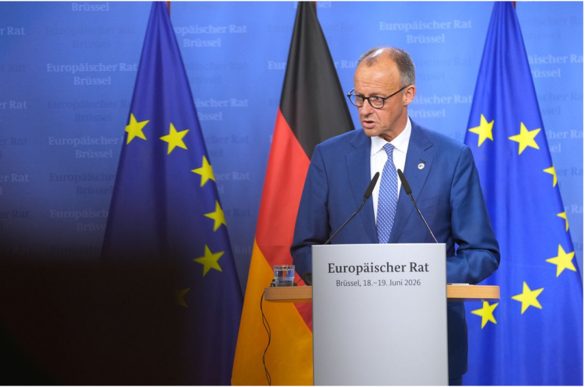
පර්මානු වානසලර් ෆ්‍රෙඩ්රික් මර්ස් 2026 ජූනි 18-19 දිනවල බුසල්ස් හි පැවති EU සමුළුවේදී කතා කරයි.

දැන් බුසල්ස් නිදී සම්මත කරගෙන ඇති වැඩපිළිවෙල යනු මෙම යුද න්‍යාය පත්‍රය යුරෝපය පුරා ක්‍රියාවට නැංවීමයි.